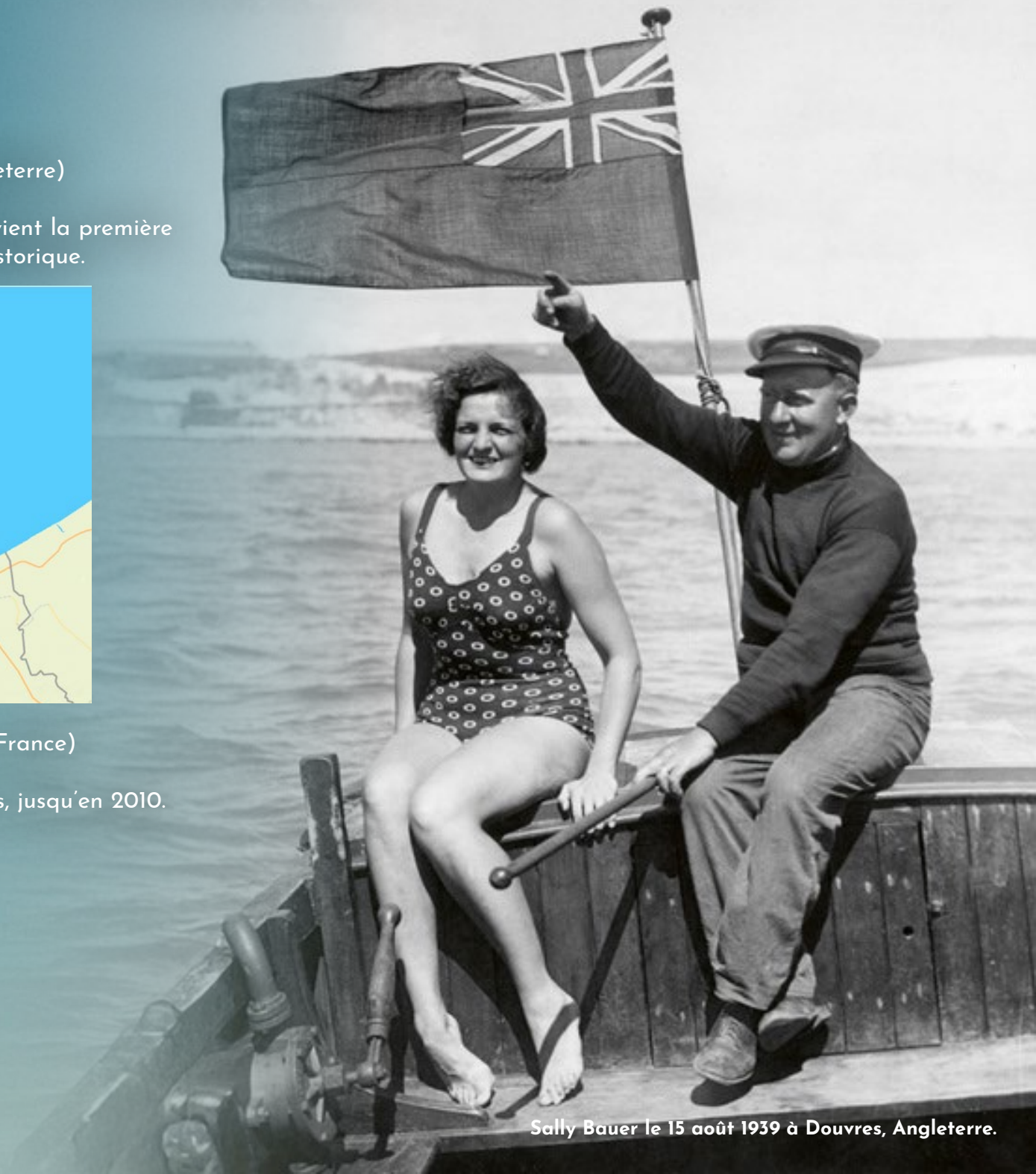
Sally Bauer le 15 août 1939 à Douvres, Angleterre.